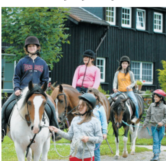
Endlich an der frischen Luft: Nach dem Unterricht in der Reithalle durften die Kinder über den Hofbis in den Wald reiten.