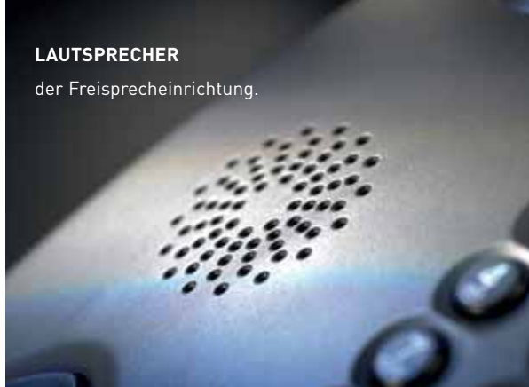
LAUTSPRECHER der Freisprecheinrichtung.