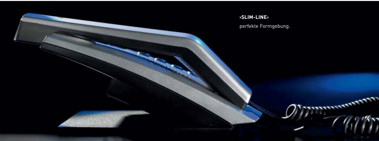
›SLIM-LINE‹ perfekte Formgebung.