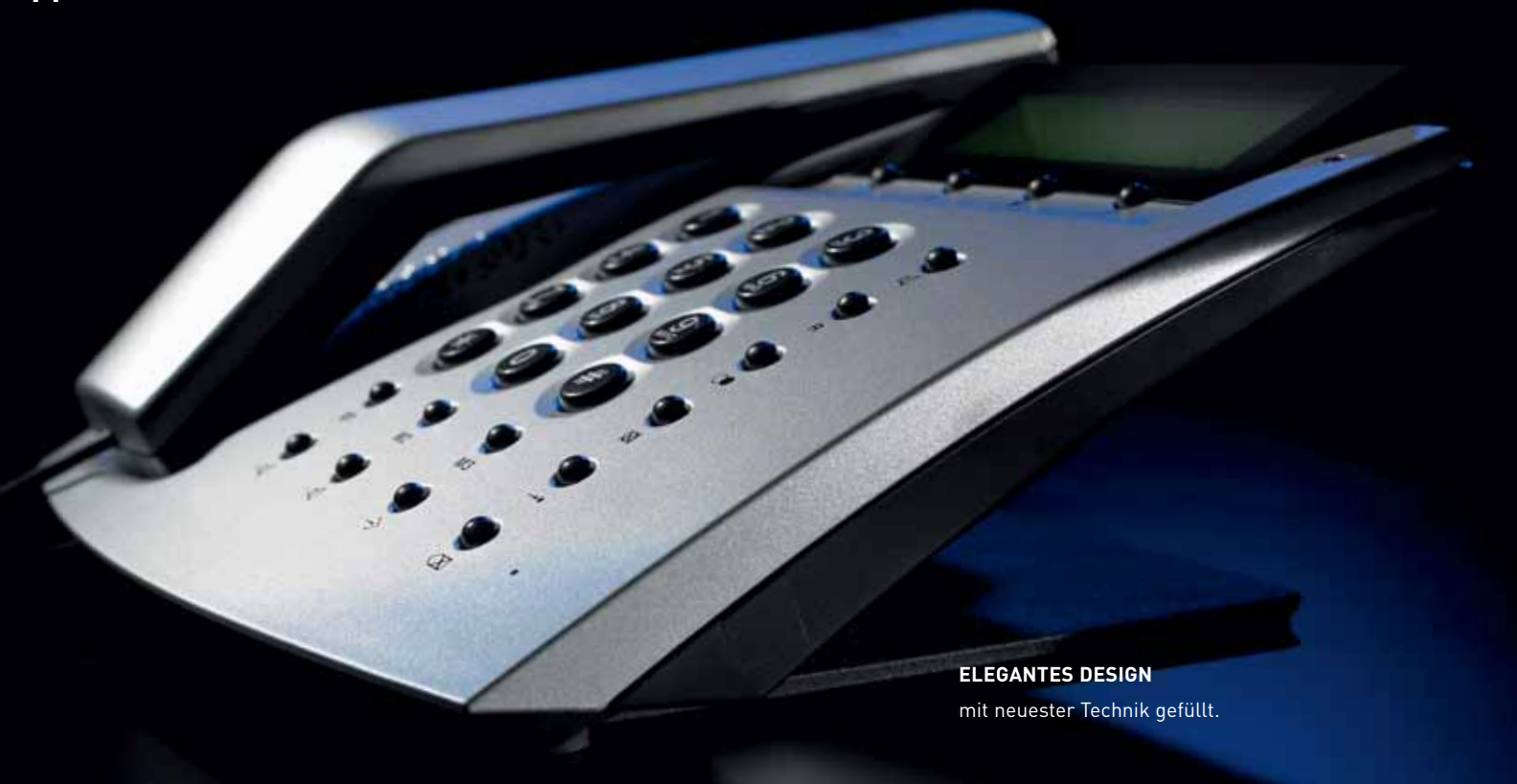
ELEGANTES DESIGN mit neuester Technik gefüllt.